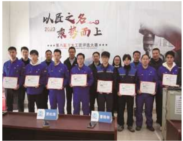
2023年度“方大工匠”评选现场