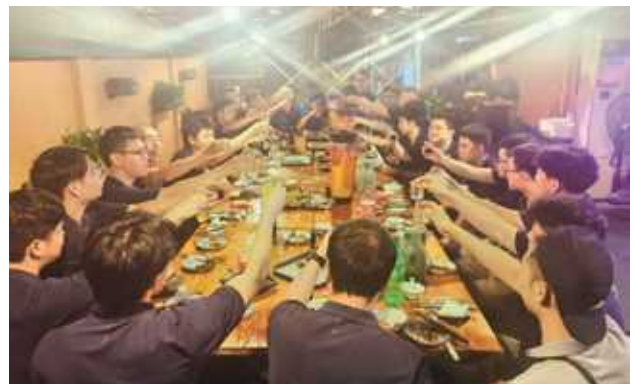
方大集团中秋节日活动