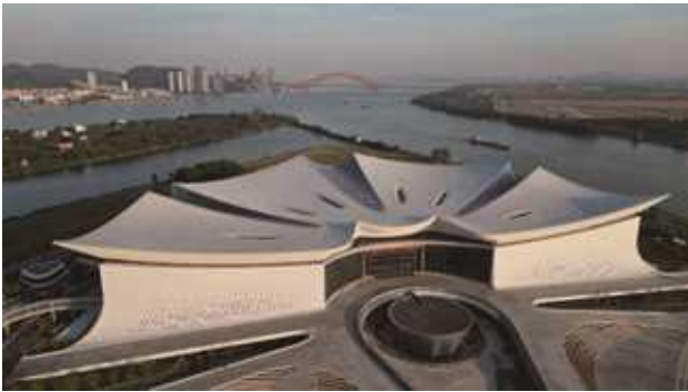
广州南沙国际金融论坛（IFF）永久会址项目