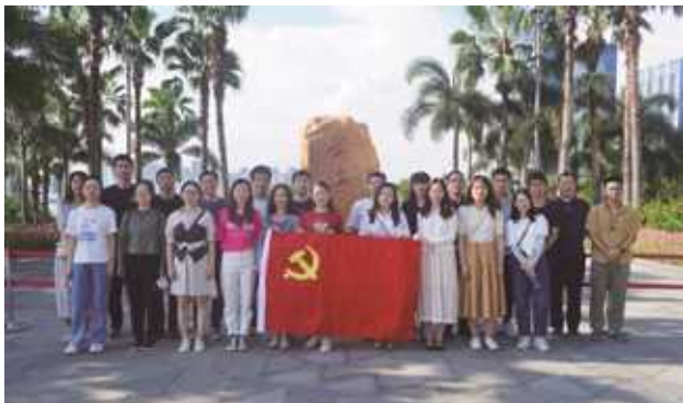
前海石公园参观学习现场

6月10日，方大集团党委组织在深圳党员干部前往前海石公园，重温习近平总书记重要讲话精神，参观前海开发开放成果展。通过讲解员的讲述，党员干部了解了前海发展历史，认真学习了习近平总书记三次到前海的重要指示精神，实地感悟了习近平总书记对前海建设的深切关怀和殷切期望。