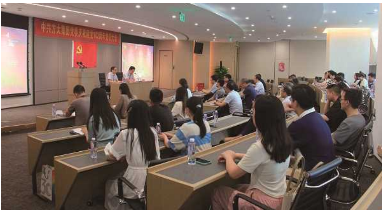
庆祝中国共产党成立102周年党员大会现场

6月30日，方大集团党委在深圳总部召开庆祝中国共产党成立102周年党员大会，会上党委书记带领党员重温入党誓词，感悟伟大的建党精神，鼓励大家践行入党誓词，成为公司发展的中流砥柱。会上党员发展对象代表发言，表示要以共产党员的标准严格要求自己，求实创新，矢志奋斗。