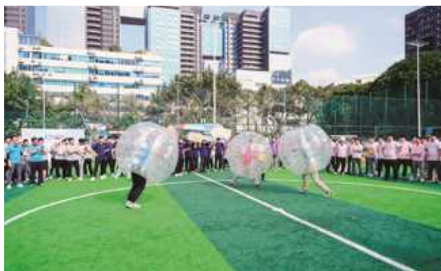
方大集团员工趣味运动会