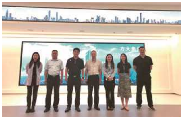
方大集团2023年校企交流

公司持续积极开展校企合作交流，为帮助在校毕业生尽早了解就业市场，在校期间更有针对性的对学业和个人进行规划，方大集团分别接待了来自大连大学、大连民族大学、广东理工学院等院校就业负责人和学生，并就学生关心的问题作了深入交流和沟通，为在校大学生的职业生涯规划提供了指导，也为大学生全面发展提供了广阔的平台和机会。