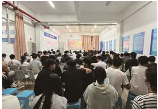
方大集团2024届校园招聘

公司持续积极开展校企合作交流，为帮助在校毕业生尽早了解就业市场，在校期间更有针对性的对学业和个人进行规划，方大集团分别接待了来自大连大学、大连民族大学、广东理工学院等院校就业负责人和学生，并就学生关心的问题作了深入交流和沟通，为在校大学生的职业生涯规划提供了指导，也为大学生全面发展提供了广阔的平台和机会。