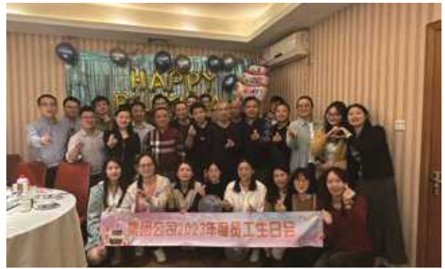
方大集团员工生日会活动