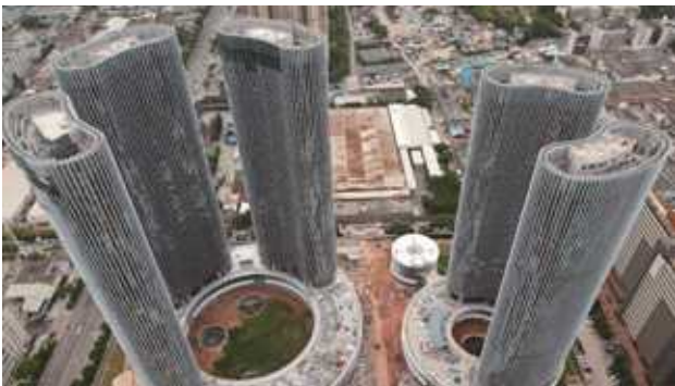
OPPO 长安研发中心项目