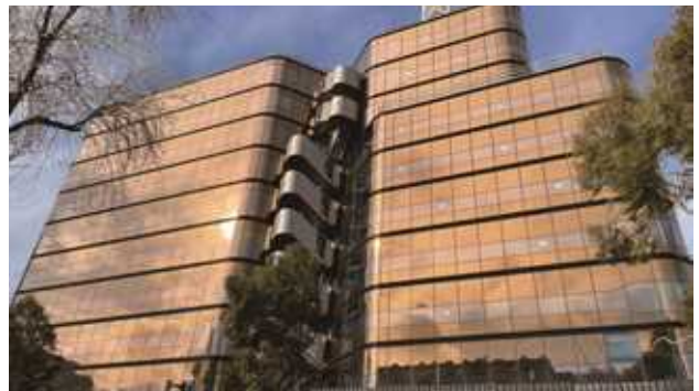
澳大利亚 Victoria Place

● 智慧幕墙及新材料产业中标签约 525,410.02 万元,较去年增长 8.60%, 订单储备达 684,083.75 万元。