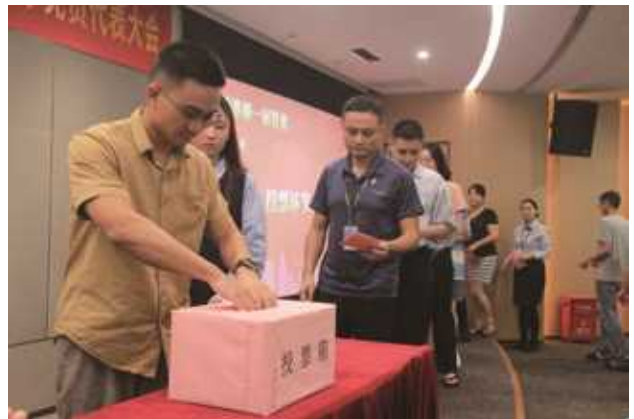
换届选举党员代表大会现场